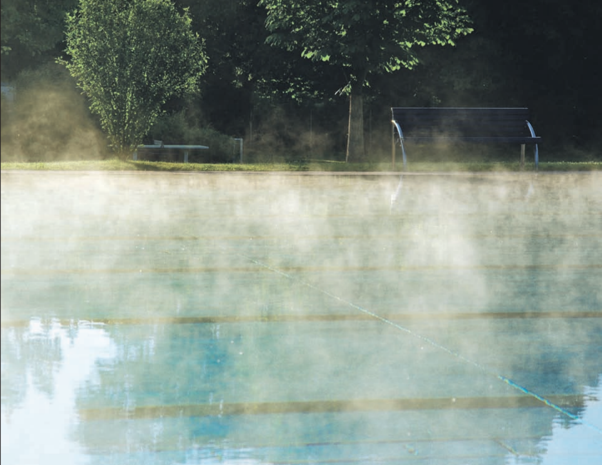
Wenn frühmorgens die Natur erwacht, liegt noch der Dunst über den Schwimmerbecken.

Das Nürtinger Freibad wartet mit einem 50-Meter-Schwimmerbecken, einem Nichtschwimmerbecken und einem Kinderplanschbecken auf. Außerdem gibt es Attraktionen wie den Strömungskanal, Wellenbad, Breittrutsche und eine Sprunganlage. Auf der Spielwiese ist Platz für Tischtennis, Beach-Volleyball, Fußball oder Basketball. Das Freibad hat dienstags bis freitags von 7 bis 20 Uhr geöffnet. Am Wochenende und montags kann man von 9 bis 20 Uhr das Bad besuchen. Kassenschluss ist um 19.30 Uhr, Badeschluss um 19.45 Uhr.